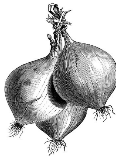
FIG. 739. TREBONS ONIONS.

CANTUCCI DI PRATO ALLE MANDORLE CON VINSANTO 7,00 TRADITIONAL HOMEMADE ALMOND COOKIES WITH SWEET WINE